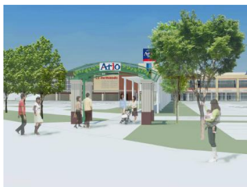
<ウェルカムゲート(南側)>

お客様への“おもてなしの気持ち”を表現したい、という思いを込めて「ウェルカムゲート」「エントランス」を設置