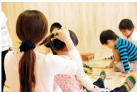
<グローバルキッズ>