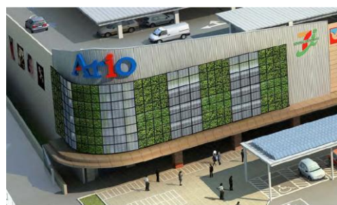
<壁面緑化と太陽光パネル>

ツタ植物等による壁面緑化と屋上緑化（合計 988 m 2 ）や、既存樹木等にて、CO 2 削減・ヒートアイランド抑制効果を推進