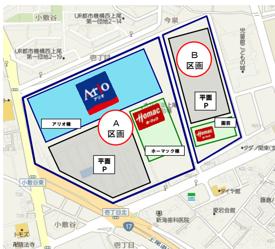
<出店地の区画概要>

上尾市最大級となる『アリオ上尾』は、当社が展開するモール型SC「アリオ」として全国で16ヶ所目（埼玉県で4ヶ所目）の出店になります。また、イトーヨーカドーとしては全国179店舗目（埼玉県で25店舗目）の出店となります。