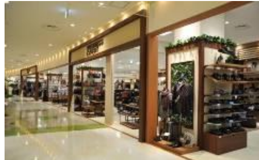
<「BUSINESS EXPERT（ビジネスエキスパート）」>

イタリアンクラシックをベースにほどよくアメリカントラッドをミックスした上質かつベーシックなビジネススタイルをショップ形式でご提案。メンズおよびレディスのスーツやシャツ、ブラウス等を展開 ※写真はイメージ