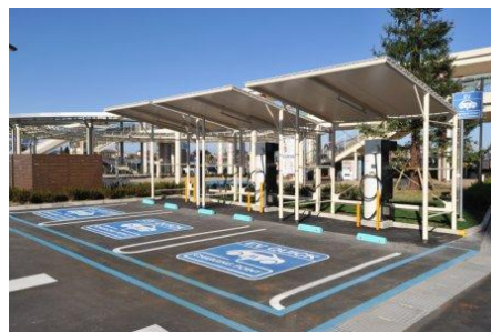
<電気自動車充電装置>

電気自動車専用の急速充電器 2 台、普通充電コンセント 1 台、計 3 台を平面駐車場に設置。また、電動アシスト自転車専用の充電スタンドを店内外に 3 台設置 ※右写真はアリオ鷺宮店