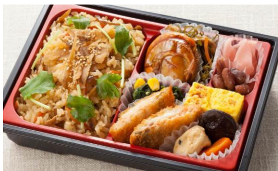
イトーヨーカドーオリジナル 【青森～北海道 味のかけはし弁当】