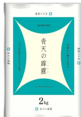
【平成27年産 青森 青天の霹靂】