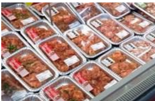
【味付けお肉の商品イメージ】