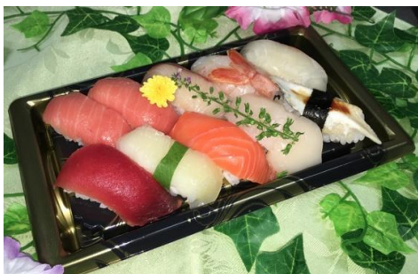
【お魚屋さんのお寿司】