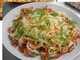
【惣菜売場 イメージ】