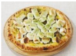
【焼きホワイトチョコの抹茶マシュマロピザ】