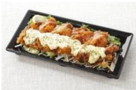
【チキン南蛮のサラダ】