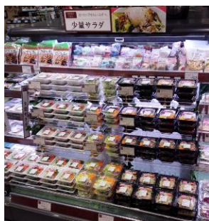
【少量サラダコーナー】