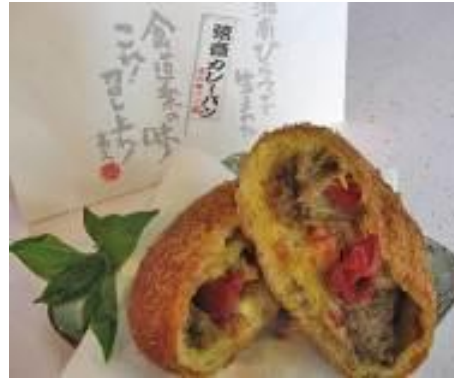
げんさい 【弦齋カレーパン】

またカレーパンの他にも、自家製食パンや、マフィン等もご用意し、パン売場でコーナー展開いたします。