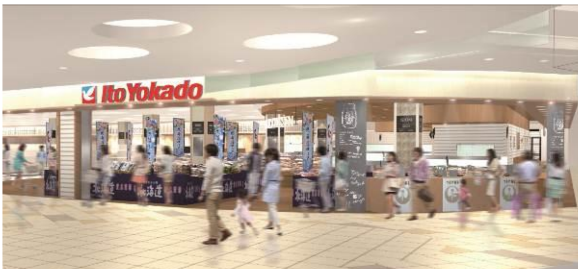
【『食品館ららぽーと湘南平塚店』イメージ】

また、新たな取組みとして、近郊の平塚漁港で採れる朝漁近海魚を使用した「お魚屋さんのお寿司」や、食品館最大の30品目のおかず惣菜を取り揃えた「バイキングコーナー」、簡単・便利で主菜にもなる「おかずサラダ」、「ワンプレート弁当」等のこだわり商品をご提供いたします。さらに、「贅沢ういのパスタソース」や「贅沢クリームシチュー」等、人気の食品館イトーヨーカドー限定商品も約60品目取り揃え、地域のお客様に豊かな生活をご提案してまいります。