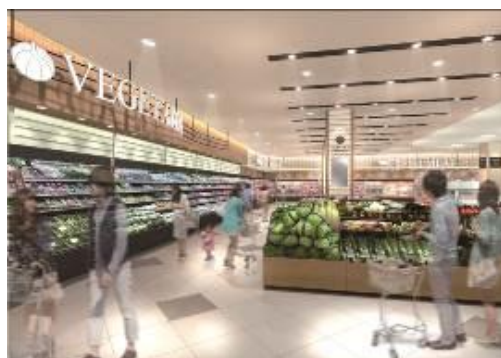
【青果売場 イメージ】