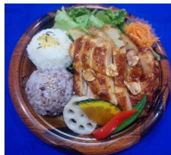
【バーベキューチキンプレート弁当】