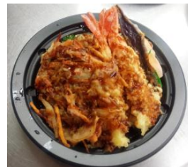
【当店限定「平塚店天井」】