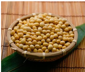
山形産『里のほほえみ』