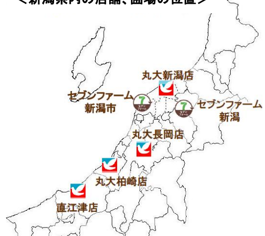
<新潟県内の店舗、圃場の位置>