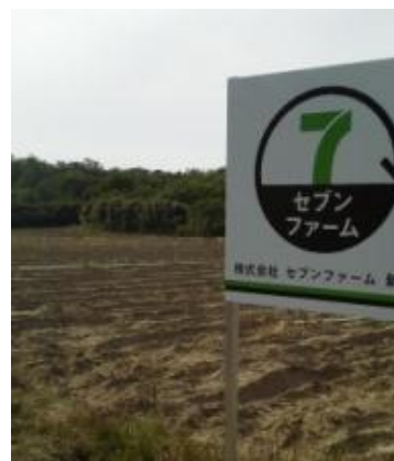
<セブンファーム新潟市 圃場>