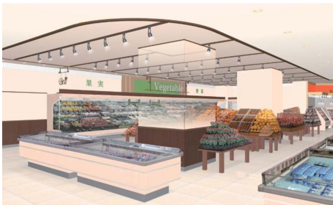
【食品館中野店 イメージ】

また、食品館初の取り組みとして、単身世帯の方やご年配のお客様をターゲットに、お弁当やおかず等の惣菜や、少量パック商品を充実させ、精肉・鮮魚売場の味付け加工をした簡便調理商品等を集約した「即食コーナー」を展開いたします。近隣にオフィスや学校等の立地もあることから、時間の限られている昼食時への対応として、専用レジをコーナー内に設け、都市型小型スーパー最大となる飲食可能な店内レストスペースも設置して、お客様により快適にお過ごしいただけるよう取り組んでまいります。