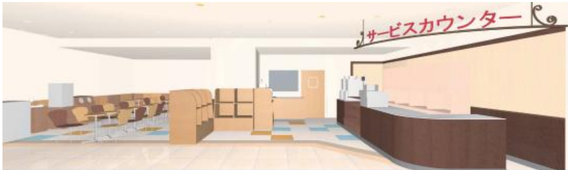
【レストスペースイメージ】

※「SEVEN CAFÉ(セブンカフェ)」とは… 2013年1月より、セブンイレブンに導入した、店内にてオリジナル専用機器で提供する上質なセルフ式のドリップコーヒー。グループで累計販売数 4.5 億杯を突破した大人気商品