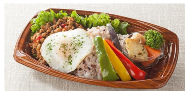
【新商品「ベジプレート」 イメージ】