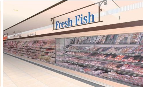
【鮮魚売場 イメージ】