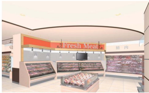
【精肉売場 イメージ】