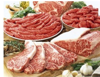
【主な商品の一例 イメージ】