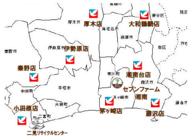
＜農場と食品残さ排出店舗の所在地＞