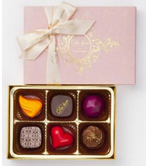
『デュ・ボン ショコラ』 6個入り／1,200円(税込 1,296円)

ほんのりと甘みのあるスパークリングワインのきめ細かい泡がチョコレートの甘さを柔らかく包み込み、キレのある辛口の味わいが後味をすっきりとまとめる組み合わせです