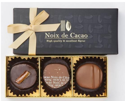
『ノワ・ド・カカオ リッシュショコラ』 3個入り／800円(税込 864円)

樽の香ばしい香りがわずかに残るスパークリングワインが カカオの香りとマッチし、より深い味わいにします