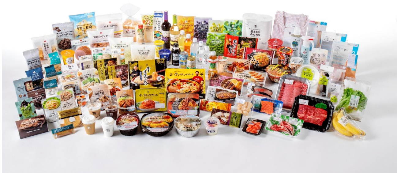
(セブンプレミアム商品一例)

『セブンプレミアム』は今後も、安全・安心で健康や環境にも配慮した商品開発に取り組み、お客様に「こんなほしかった」と喜んでいただける商品を提供し続けることで、さらなる成長を目指してまいります。