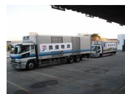
救護物資のお届け

セブン&アイHLDGSでは、震災直後から水やおにぎりなどの緊急支援物資の手配を行い、翌12日からは、陸送およびヘリコプターを利用して配送を行いました。また、グループ各社の店頭で3月13日から5月31日まで義援金募金を実施し、被災地にお届けしました。