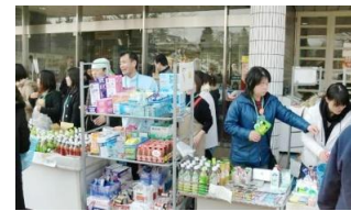
店頭で食品などの生活必需品を販売 (花巻店)

「お客様の日常生活に欠かせない商品を提供し続けることが小売業の使命」、「小売業は、電力・ガス・水道・電話・公共交通につぐ第六のインフラ」という使命感のもと、全社員が一丸となり早期の営業再開を実現しました。