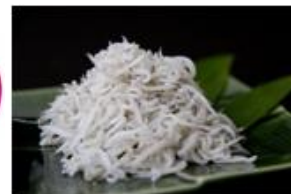
<一例：久慈浜しらす>