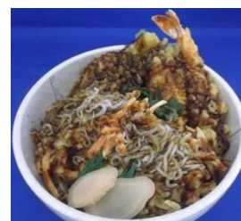
<久慈浜しらすかき揚げ丼>

地産地消・地場産品販路拡大に係る連携及び協力に関する協定締結記念として5月10日（火）～15日（日）「ひたち地場産品フェア」を実施し、日立市の地場産品（農林水産物・加工物等）の販路拡大に取り組みます。