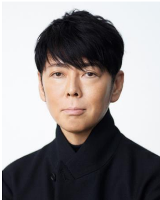
佐藤 可士和 Kashiwa Sato クリエイティブディレクター

「お客様に幸せを運び、未来に大きく羽ばたく白い鳩」は、みなさまの日々の食卓に、おいしく楽しく健康的な食をお届けしたいという、イトーヨーカドーがずっと大切にしている姿勢の象徴です。この白い鳩をデザインに掲げた「ヨーク・デリ」は、そんなイトーヨーカドーの長年の経験をベースにしながらも、現代の多様化したライフスタイルに寄り添い、品揃えや素材選びにも配慮したお惣菜をお届けするブランドです。従来の容器を集約して環境配慮に努めながら、選びやすさ、選ぶ楽しさも感じていただけるパッケージや売場環境も意識しています。『「毎日食べたい」おいしさ。』をお客様に実感していただけるブランドに育っていくことを心から願っております。