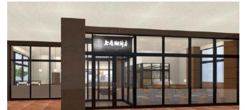
上島珈琲店（イメージ）