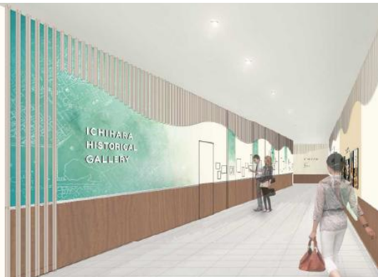
「市原歴史ギャラリー」（イメージ）