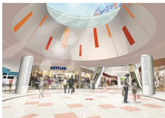
センターコート内における LED 情報発信〔柱部分〕（イメージ）