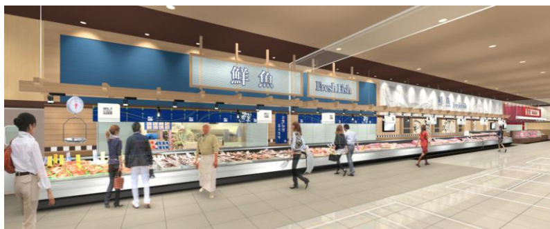
鮮魚売場（イメージ）