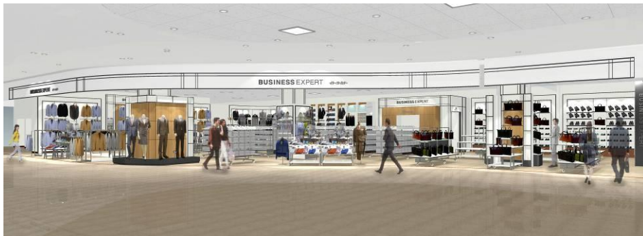
「BUSINESS EXPERT」ショップ (イメージ)