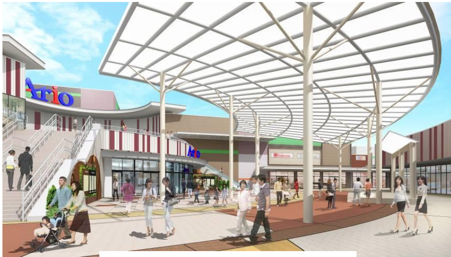
サンシャインコート（イメージ）