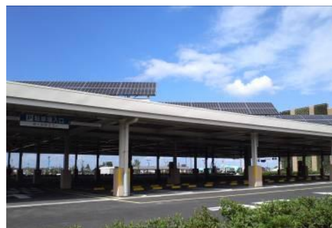
屋根付駐車場ソーパネル（イメージ）