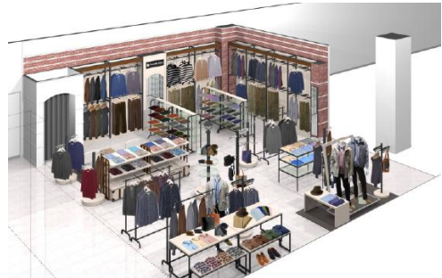
「Graceful Days」ショップ (イメージ)