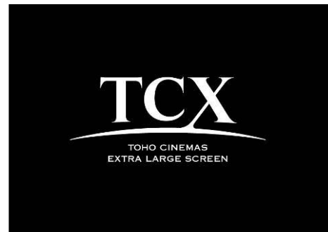
TOHO シネマズのラージスクリーン「TCX」

〔独自規格のラージスクリーン「TCX (TOHO CINEMAS EXTRA LARGE SCREEN)™」をメインスクリーンに導入します(スクリーンサイズは約19m×8m)。インターネットチケット販売サービスや会員サービス等、これまでのノウハウを活かしながら満足度の高いサービスを提供。ハード・ソフトの両面で最高品質のシネマコンプレックスを目指します。〕