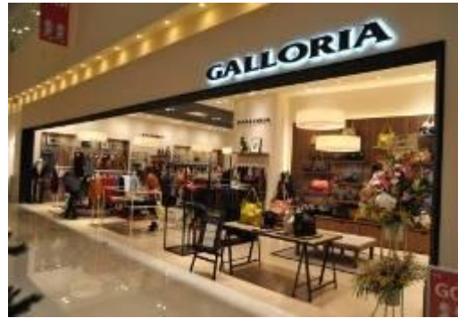
「GALLORIA」ショップ (イメージ)