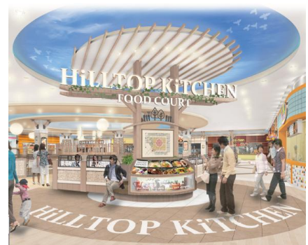
フードコート（イメージ）