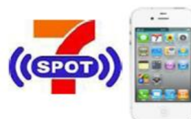
「セブンスポット」（イメージ）