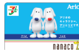
アリとリオ verの「nanaco」カード