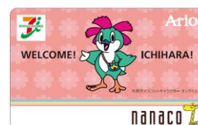
「オッサくん」モチーフの「nanaco」カード