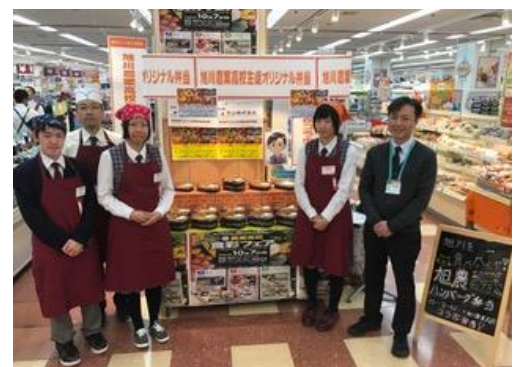
平成29年度開催食彩フェアの様子

地元高校と連携し、地産地消・地場産品の開発から地域活性化に繋げるイベントを開催致します。この取り組みは2006年よりイトーヨーカドー北海道内の各店舗で実施されている取り組みで、今回の締結を機に旭川市内の高校等との連携強化を図ります。