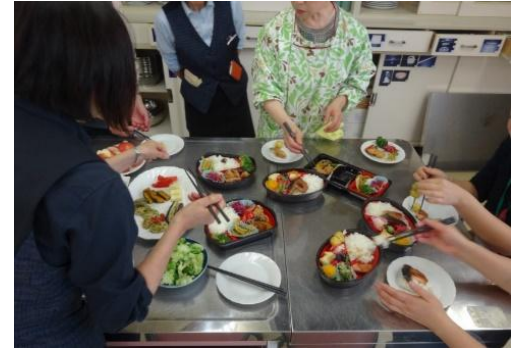
「1食分の栄養バランスがとれる弁当」の開発風景

また、店舗内階段に消費カロリー表示を設置し、店舗を活用した運動量アップの取組を進めるなど、市民の皆様の健康増進に繋がるような各種啓発イベント等を積極的に実施して参ります。