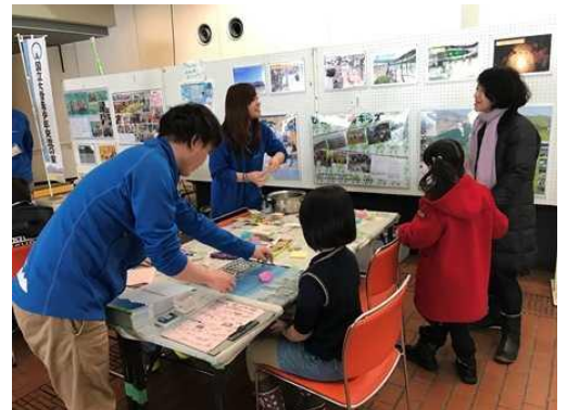
昨年第26回生涯学習フェアの様子

生涯学習フェアでは日頃の生涯学習活動の成果を発表する場として開催されます。2018年2月10日（土）、11日（日）の2日間開催される第27回生涯学習フェア「まなびピアあさひかわ」をイトーヨーカドー旭川店で開催致します。