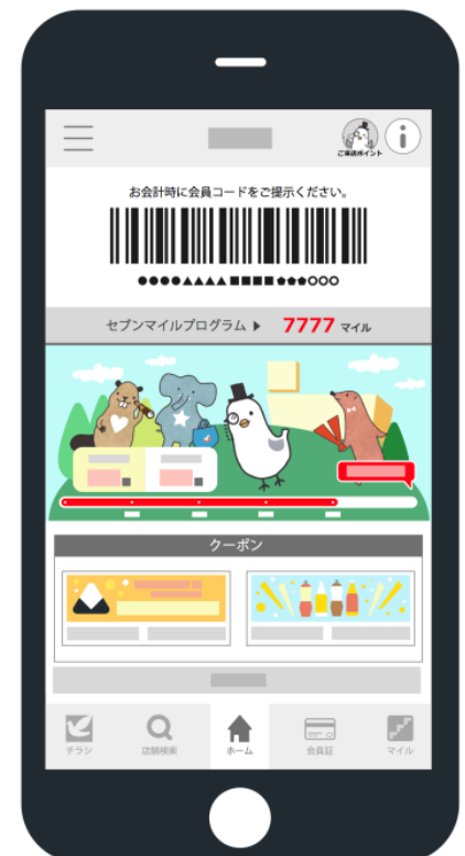
※画面はイメージです

➢ 購入商品の金額等に応じてマイルを付与 例えば、イトーヨーカドーでの購入時レジでバーコードをスキャンすると、購入金額に応じてお得な特典、体験型イベント等に応募が可能。