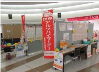
福島県：郡山店 行政連携した啓発イベント