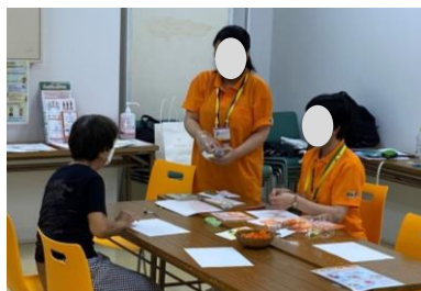
千葉県：津田沼店 相談会の実施