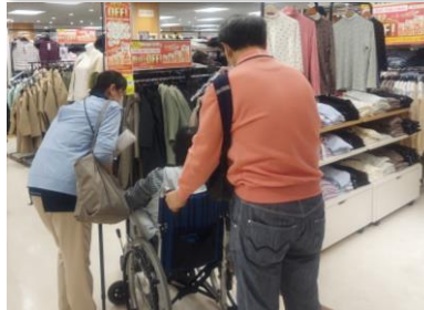
神奈川県：新百合ヶ丘店 お買い物ツアー