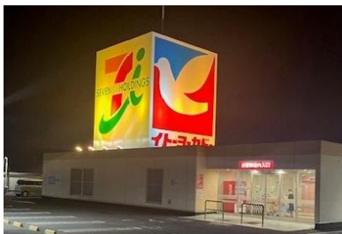
宮城県：石巻あけぼの店 ライトアップ

イトヨーカドーは今後も地域コミュニティの拠点として、誰もが暮らしやすい社会となるよう、ステークホルダーの皆さまと連携し、社会貢献活動に取り組んで参ります。