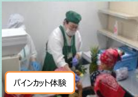
パインカット体験