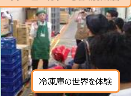
冷凍庫の世界を体験