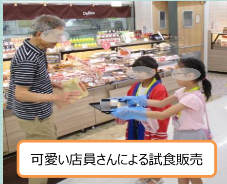
可愛い店員さんによる試食販売