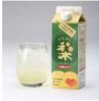
【市原市】情熱市原ワンハート （いちはら梨ベース）