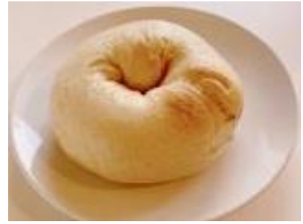
【四街道市】ベーぐるきっちん （プレーンベーグル）