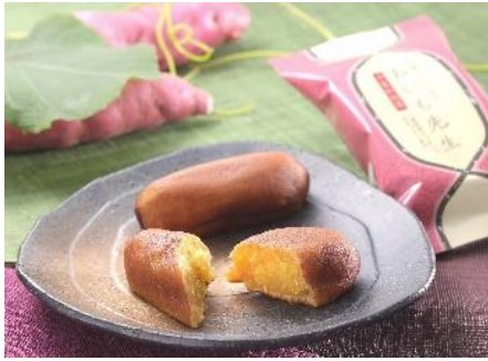
【千葉市】オランダ家（おいも先生）