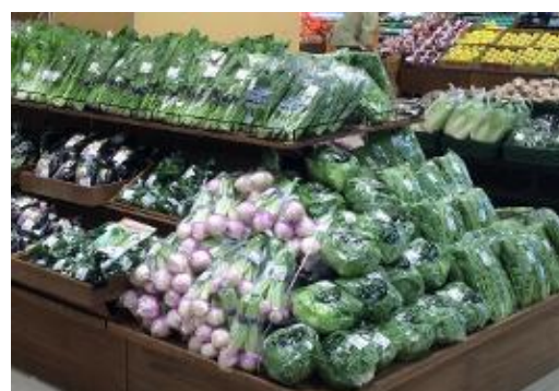
【青果売場 イメージ】