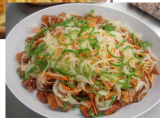
【惣菜売場 イメージ】