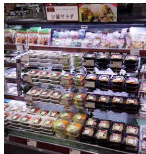
【少量サラダコーナー】