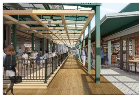
・グリーンマーケット間通路 イメージ図