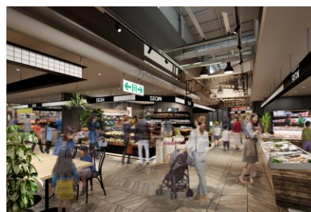
・グリーンマーケット イメージ図

地域のこだわりの食材専門店、お惣菜やスイーツなど地域の台所となる市場として展開いたします。