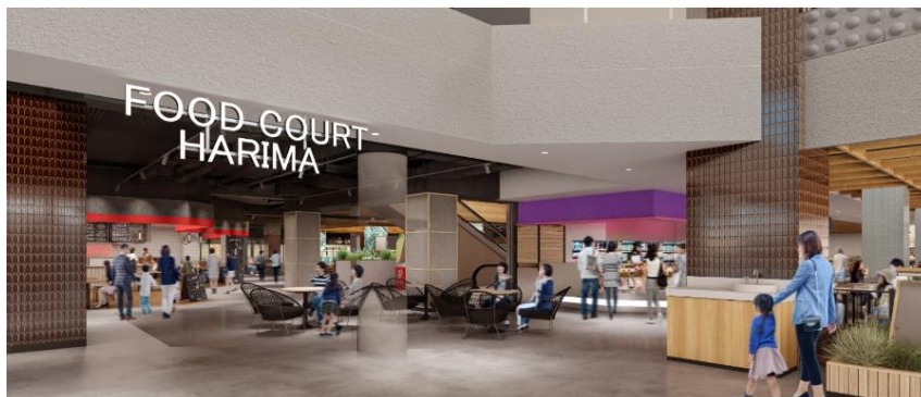
・フードコートハリマ イメージ図

約 700 席を備えたフードコートハリマでは、新たに 8 店舗加えた、計 12 店舗のバラエティ豊かな飲食店が出店します。施設デザインは多木浜洋館をモチーフとし、ご利用されるお客様に迎賓館のおもてなし空間を体感していただける造りとなっております。