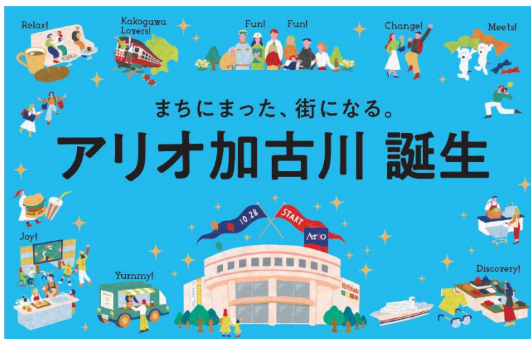
・アリオ加古川誕生キービジュアル

グリーンプラザべふは、1885年より創業を続けている多木化学株式会社の、地域の活性化を目指した不動産事業よりこれまで運営されてまいりました。今回、同社の協力を得てアリオ加古川としてオープンすることで、都市としての発展と、地域のにぎわい拠点となるショッピングセンターとして生まれ変わります。