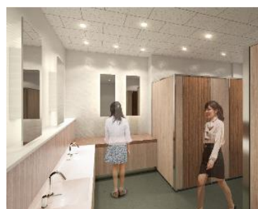
・女性用イメージ図