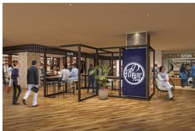
・播の郷イメージ図