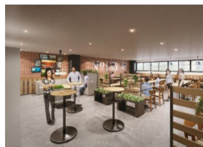
・従業員食堂イメージ図

毎日使う食堂だからこそ、行きたいと思えるカフェのような空間とすることで、休憩や食事の際に、くつろげる憩いの時間を生み出します。