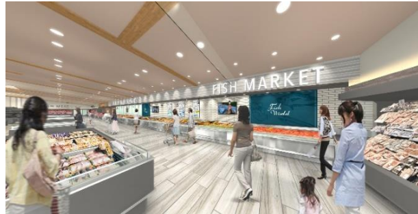
・鮮魚売場 イメージ図