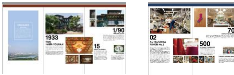
・2F 掲出内容イメージ図

2階は多木化学、棋士、国包建具、くつ下、加古川の文化、産業についてそれぞれにまつわる数字を切り口に加古川の魅力を再発見できる展示スペースとなっております。