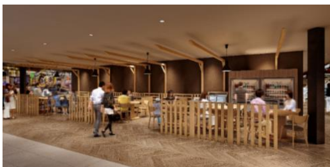
・グリーンマーケットイートインスペース イメージ図

約 50 席のイートインスペースも新設し、出来立てをその場で楽しめる空間となります。また、フードコートハリマとグリーンマーケット間の通路を繋げ、利便性の高い導線と開放的な共有スペースを設けました。