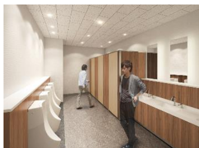
・男性用イメージ図

消臭機能に優れた消臭セラルールを壁装材に使用、床材も植物性原材料の天然効果による抗菌性、抗ウイルス性がある床材として注目されているマーモリウムという素材に変更いたしました。手洗いカウンターは、フラットな仕様とすることで菌の発生、増殖する箇所を減らす素材を使用し、衛生的な環境となっております。お客様と触れ合う従業員だからこそ清潔な環境を使用していただけるよう快適な環境を整備しました。