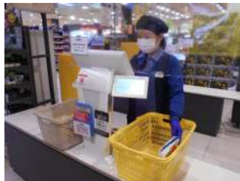
レジ・カウンターの透明シート設置