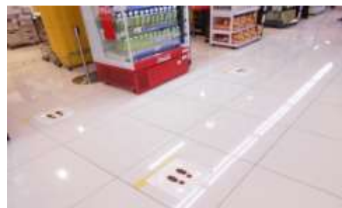
レジの足型サイン表示