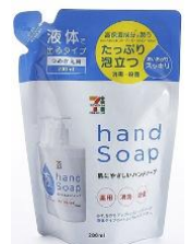
【セブンプレミアム】再生材料を使用した商品の一例