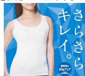
例)【セブンプレミアム】 ボディークーラー(肌着)