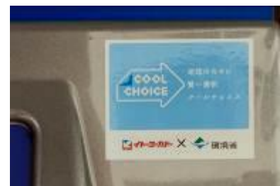
【COOL CHOICE “賢い選択、”のロゴを添付して展開】

お客様が自動回収機に投入されたペットボトルは、機械の中で自動的に選別、1/8に減容され、リサイクル工場に運ばれます。運搬車両も大幅に削減ができ、そこで再びペットボトルやプライベートブランドの「セブンプレミアム」の容器などに生まれ変わります。