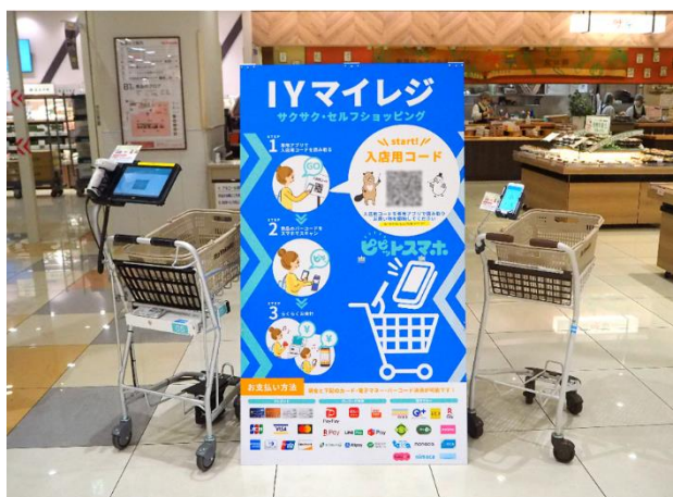
・IY マイレジ ピピットカート / ピピットスマホ

株式会社イトーヨーカ堂（本社：東京都千代田区、代表取締役社長：三枝富博）と、東芝テック株式会社（本社：東京都品川区、代表取締役社長：錦織弘信、以下「東芝テック」）は、カート・スマホを活用したセルフレジシステム（IY マイレジ ピピットカート / ピピットスマホ）によるレジ業務効率化に向けたデジタルトランスフォーメーション（DX）施策を実施します。