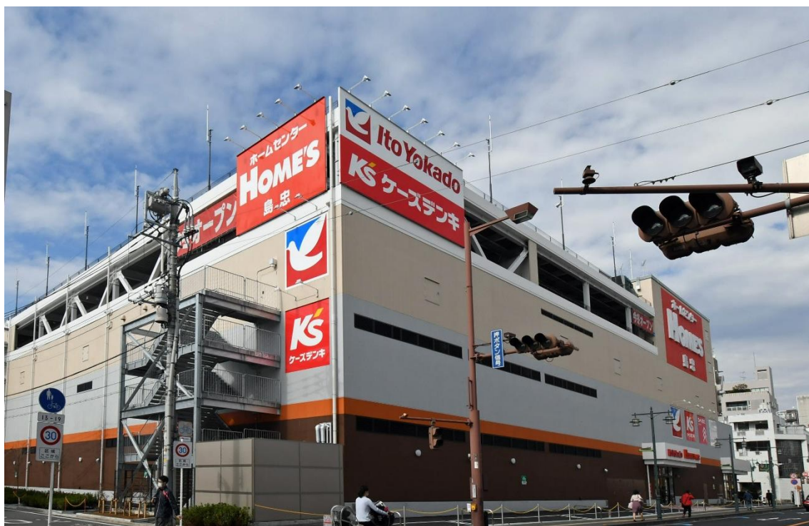
『イトーヨーカドー西川口店』イメージ

西川口店は、幅広い年代層の皆様がより便利にお買い物できる場のご提供を通じて、お客様の暮らしをサポートしてまいります。