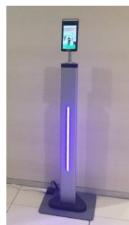
お客様用非接触検温システム