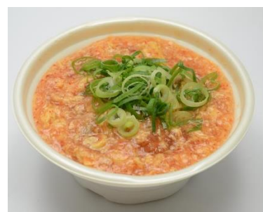
「上大岡店 かきたまにんにく ラーメン」イメージ