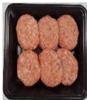
「手作り風ハンバーグ」 イメージ