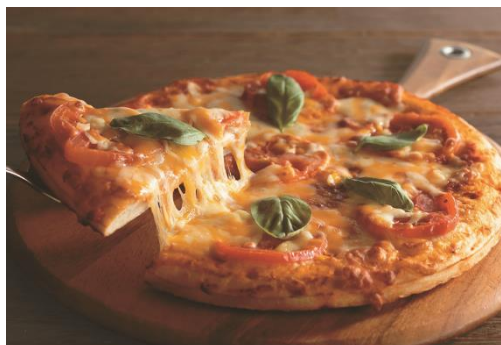
「フレッシュトマトのマルゲリータ」イメージ