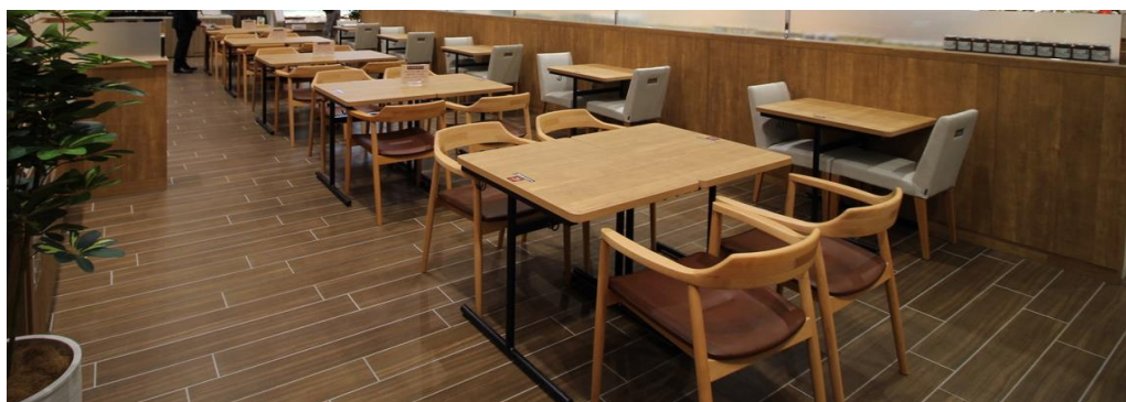
「イートインスペース」イメージ