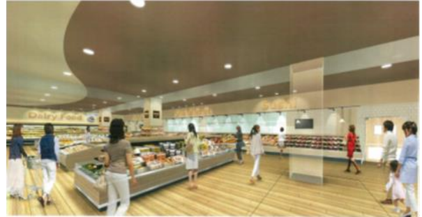
「惣菜売場」イメージ