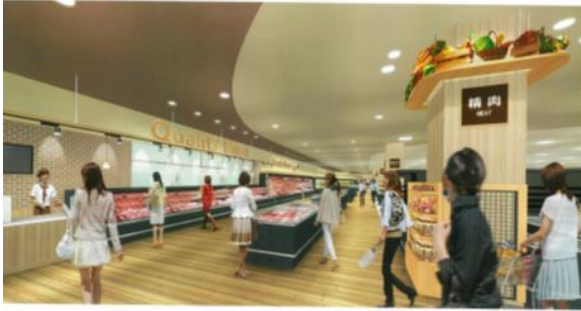
「精肉売場」イメージ