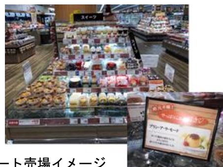
デザート売場イメージ