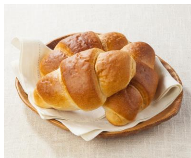
焼きたてパンイメージ