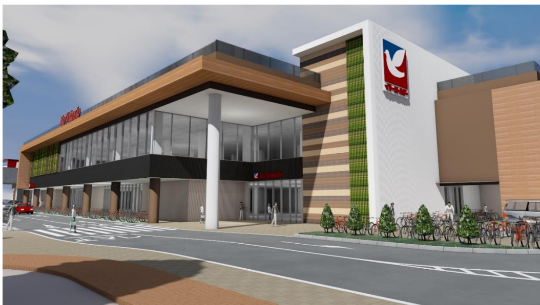
「イトーヨーカドー食品館上大岡店」イメージ

食品館上大岡店は、地域に密着した幅広い品揃えとサービスのご提供を通じて、お客様の生活シーンに新たな価値をご提案してまいります。