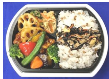
「鶏と野菜の彩り野菜弁当」 イメージ