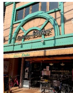
地元で人気のパン屋「デューク」