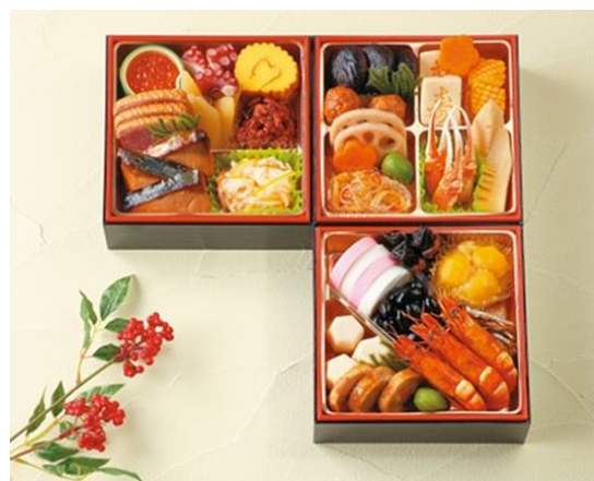
『舞鶴』 お品数 26 品目 13,800 円 (税込 14,904 円)

◆オムニ 7・イトーヨーカドーネット通販 URL : https://iyec.omni7.jp/fair/F04OSE0000