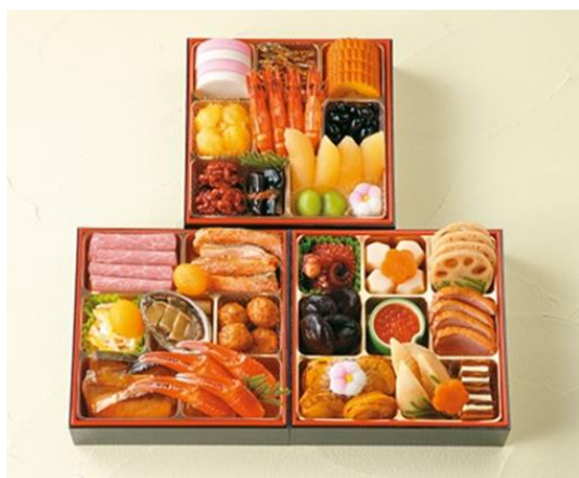
『芝花』 お品数 30 品目 19,800 円 (税込 21,384 円)