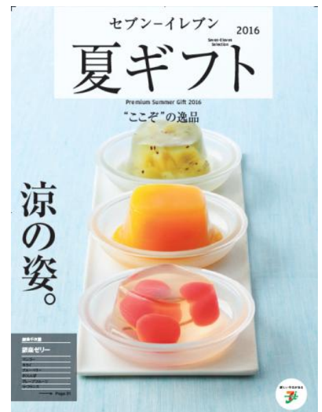
「2016年 セブン-イレブンの夏ギフト」カタログ