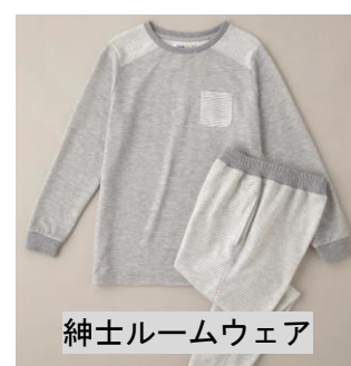
紳士ルームウェア