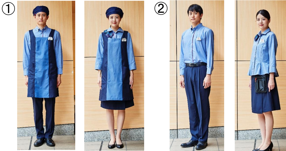
① 食品レジ、銘店担当 ・右記にベレー帽とエプロンを着用

イトーヨーカドーは、今後も新制服の導入を機にブランド価値の向上と、お客様のお買い物を豊かにするご提案をまいります。