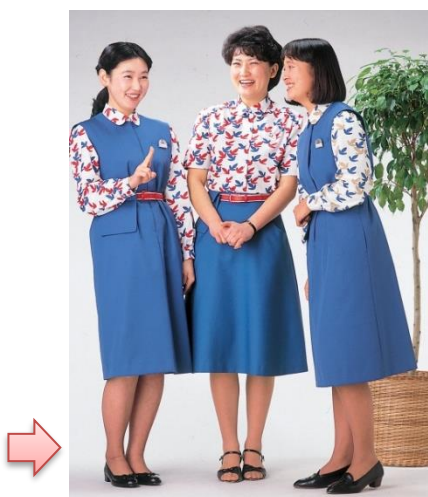
【1984年】改定 森英恵氏デザイン