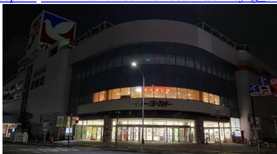
• 昨年実施時のイトーヨーカドー店舗

https:// www.7andi.com/sustainability/g_challenge/project/lightdown2022/index.html