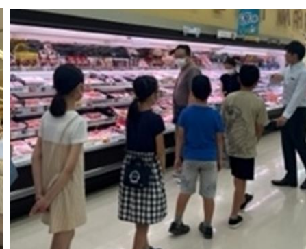
※昨年実施したイベントの様子