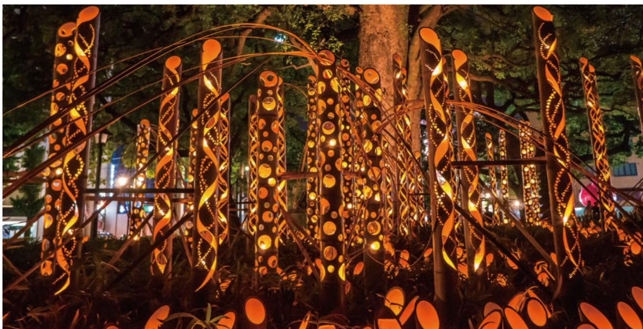
“竹あかりオブジェ”イメージ

プライムツリー赤池は、今回の取り組みを機に『赤池まち灯り』が赤池エリアの新たな夏の風物詩となるよう、地域の皆様との連携を更に深めてまいります。