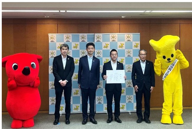
写真左から YO千葉ゾーンマネジャー 向井 千葉県 熊谷知事 IY京葉ゾーンマネジャー 佐野 千葉県環境財団 入江理事長

イトーヨーカ堂は今後もプラスチックごみ削減に向け、マイバッグ持参の推奨や、お客様とともにペットボトル回収などのサーキュラーエコノミー活動などを推進し、持続可能な社会の実現に貢献してまいります。