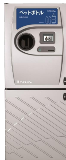
イトーヨーカドーに設置されている ペットボトル回収機（イメージ）

その他、セブン - イレブン（一部店舗）、ヨークベニマル・ヨークマート（一部店舗を除く）でも、店頭でペットボトル回収機を設置し、再利用する取り組みを進めております。