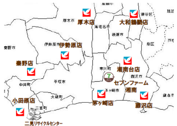
＜農場と食品残さ排出店舗の所在地＞