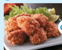
九州産華味鳥 和風から揚げ (220g)