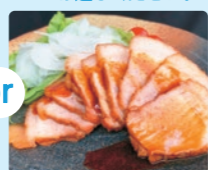
焼豚P 焼豚スライス (130g)