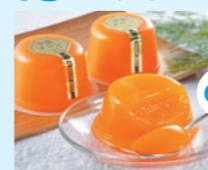
夕張メロン ゼリー ネオ (90g×6)