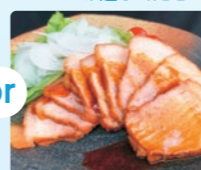
焼豚P 焼豚スライス (130g×3)